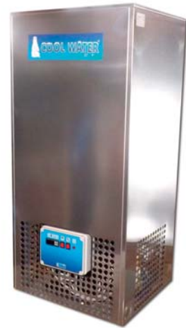
CW 100 / 200 / 300 / 500