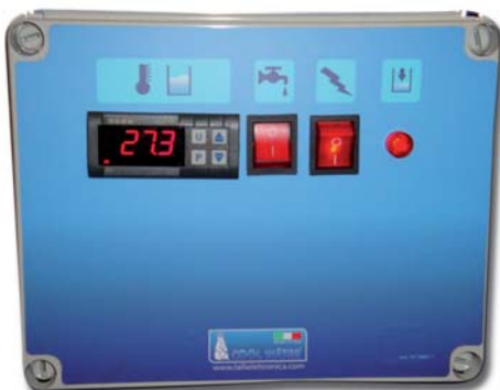
PANNEAU DE CONTRÔLE CWR