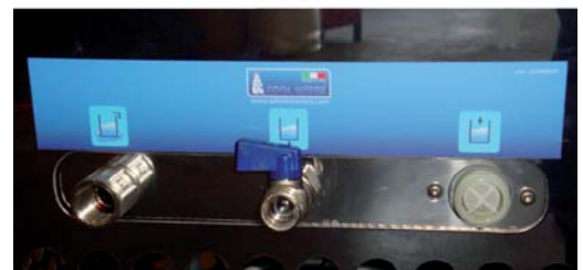
ÉQUIPEMENT DE CONNEXIONS / SOLÉNOÏDE