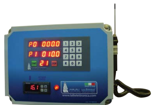
PANNEAU DE CONTRÔLE CWR - D CWR -RD