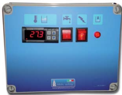
PANNEAU DE CONTRÔLE